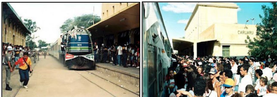
Figuras 01 e 02: Edifícios da estação ferroviária e o trem do forró