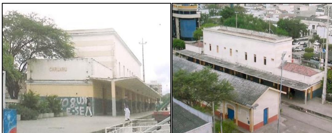
Figuras 03 e 04: Edifícios da estação ferroviária de Caruaru em 2006

Nesse ínterim, o prédio da estação permaneceu constantemente fechado e sujeito às intempéries do tempo e do clima, sem que houvesse qualquer tipo de manutenção. Esse cenário perdurou entre 2000 e 2010, recorte temporal em que a estação, já completamente desativada, também foi submetida a um processo de deterioração. As Figuras 3 e 4 exemplificam bem essa situação: ambas datam do ano de 2006 e mostram a estação com pichações e com parte da cobertura em condições precárias, evidenciando a necessidade de uma intervenção para restaurar e preservar este equipamento a fim de promover sua preservação como um aparato importante para história da cidade .