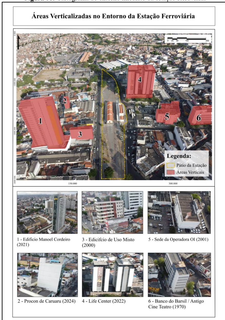
Figura 06: Cartograma do entorno imediato da estação ferroviária

Da subutilização à requalificação: Dinâmicas espaciais no entorno da Estação Ferroviária de Caruaru-PE (1990-2024).