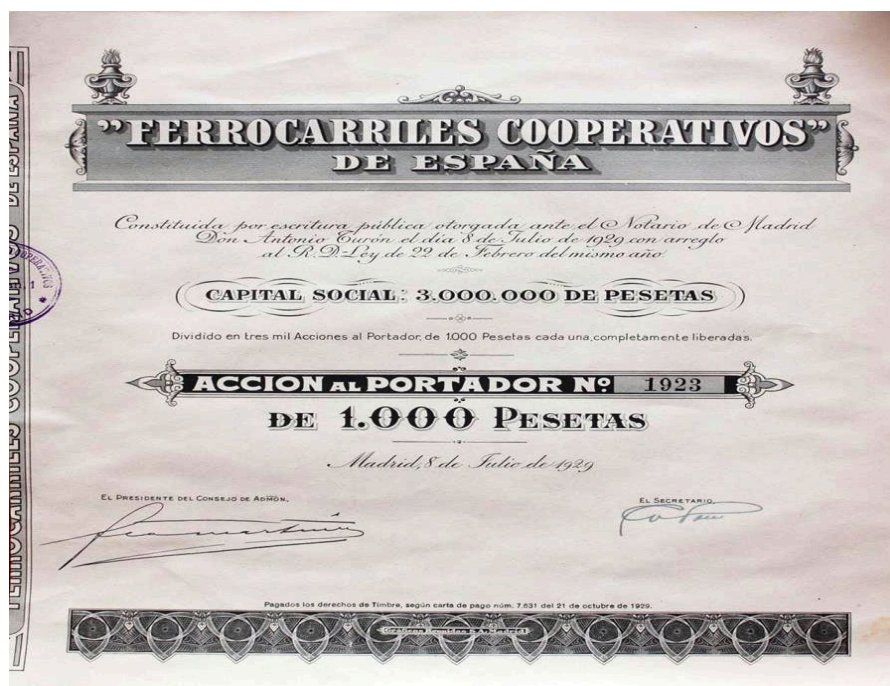
Acción n° 1823 de los Ferrocarriles Cooperativos de España. 1929

La promulgación del Real Decreto-Ley de Ferrocarriles Cooperativos en 1929 supuso la consagración normativa del modelo, impulsando la creación de la Compañía de Ferrocarriles Cooperativos de España. Así, la Gaceta de Madrid del 23 de febrero recogía en sus páginas, ya sancionada, la Ley que autorizaba la construcción y explotación de líneas de ferrocarril de interés local que, bajo el principio cooperativo, se realizasen sin subvención ni auxilio del Estado, si bien este apoyaría el normal desarrollo económico de las empresas concesionarias, confiriéndoles una tarifas que garantizaran el cumplimiento de todos los compromisos financieros, declarándolas de utilidad pública. 20 Ley celebrada por liberales y reformistas, como el manchego Rivas Moreno: “El Ministro de Fomento abre nuevos cauces al interés público, y lo que importa es que todos aprecien en lo que valen las concesiones que contiene el Decreto-ley sobre ferrocarriles cooperativos. ¡Con cuanto agrado hemos visto que se pone término a la funesta expoliación del Estado-Providencia!”. 21