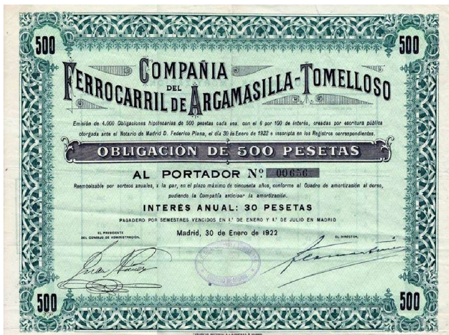
Obligación n° 656, del Ferrocarril Argamasilla-Tomelloso, emisión 1922

7 “LOS FERROCARRILES COOPERATIVOS. El último recurso de Fco. Martínez Ramírez para evitar la ruina y el ostracismo del FC de Argamasilla-Tomelloso”