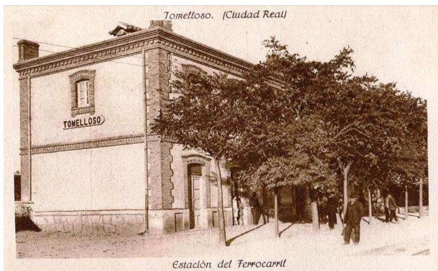
Vista parcial de la estación de Tomelloso. Postal de época, circa 1920