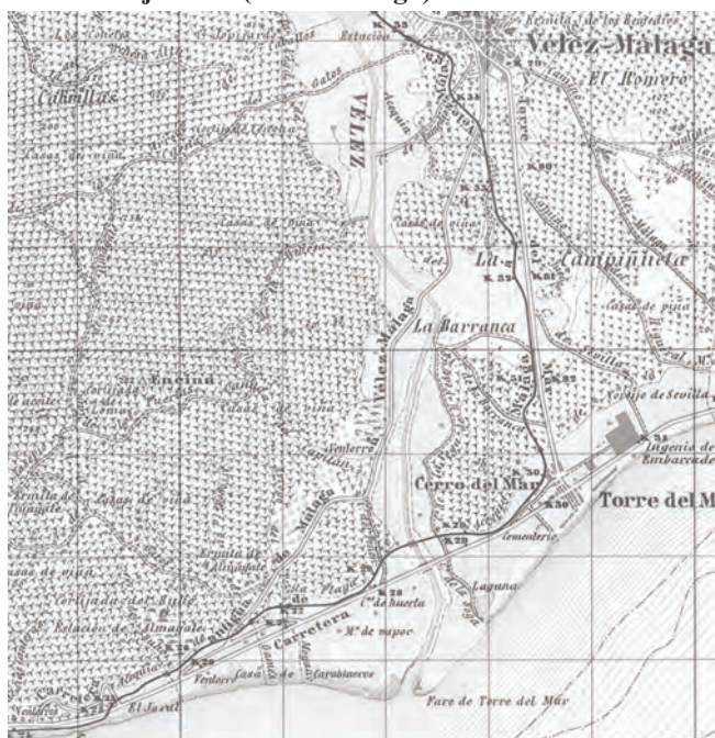
Figura 14. Tramo final del camino en las inmediaciones de Vélez Málaga. Detalle de la hoja 1054 (Vélez Málaga) del M.T.N. de 1913.