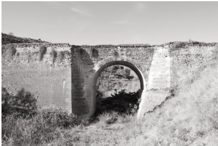
Figura 13. Puente del Arroyo del Jaral, en el descenso del Tercer Cantal