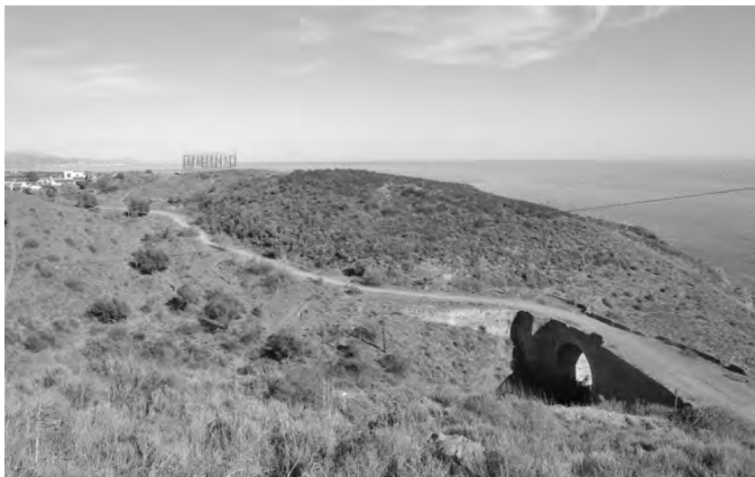
Figura 12. Tras franquear con un puente el arroyo del Jaral, el Camino enfila hacia Vélez