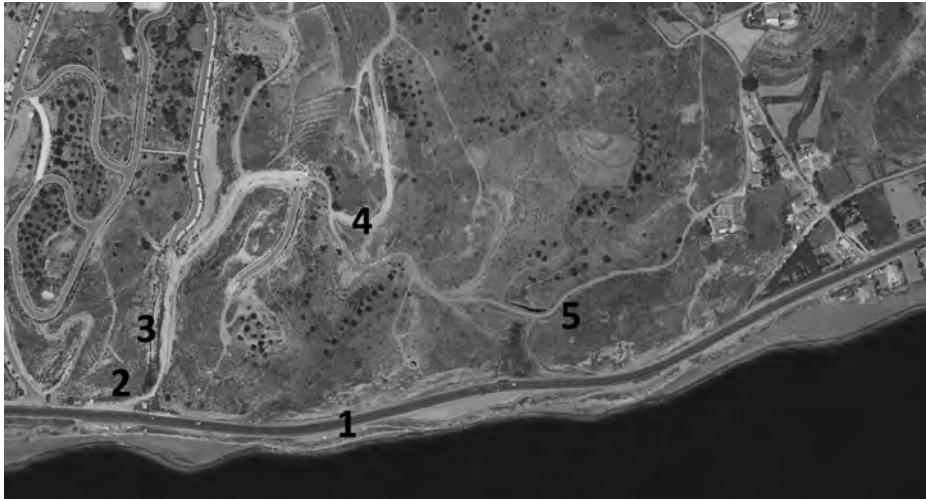
Figura 10. Ortofoto actual (vuelo 2011) de la zona del Tercer Cantal, con los elementos más representativos indicados. 1-Carretera N-340; 2-Alcantarilla; 3-Ascenso en desmonte; 4-Puerto; 5-Puente del Arroyo del Jaral.