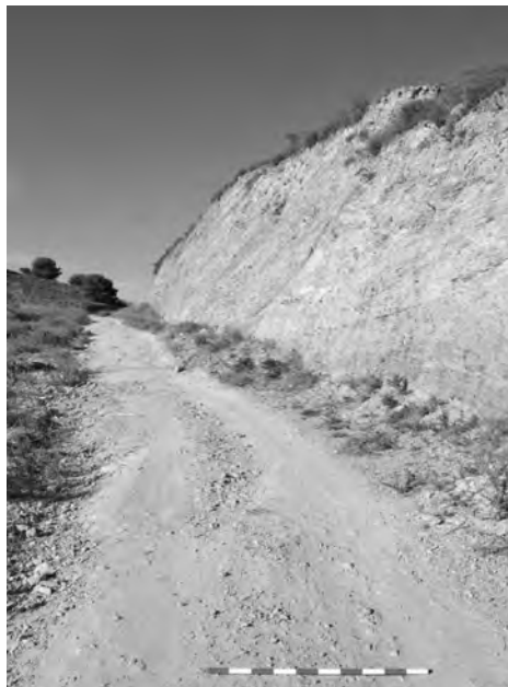
Figura 11. Desmontes del Tercer Cantal, al comenzar el ascenso de la montaña Baja-Mar