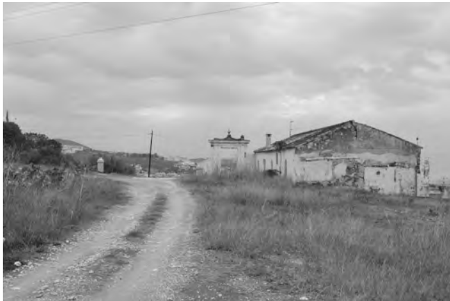
Figura 4. Fin del recorrido del camino en el Primer Cantal, con el edificio de usos varios y el pórtico monumental