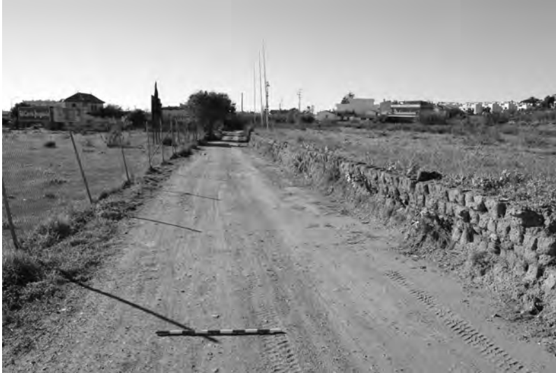
Figura 9. Tramo original del Camino de Vélez en las inmediaciones del arroyo Santillán. Torre de Benagalbón (Málaga)