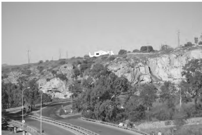
Figura 5. Lugar donde se ubicaban las rampas del Primer Cantal, en la actualidad.