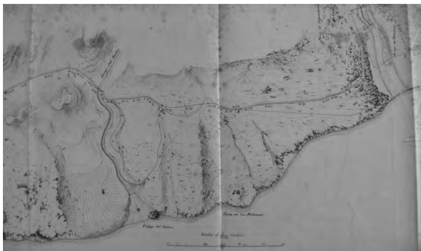
Figura 2. Proyecto de carretera de 2º orden de Málaga a Almería, parte comprendida entre Málaga y Vélez (Antonio Mª Jaudenes, 1861), plano topográfico del trozo 1º. En el Primer Cantal, el trazado propuesto de la nueva carretera coincide casi íntegramente con el Camino de Vélez. El nuevo proyecto contemplaba la reutilización del puente sobre el arroyo Judío y las rampas de descenso al arroyo Totalán.