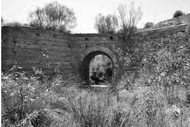
Figura 3. Puente del Arroyo del Judío, en el extremo oriental del término municipal de Málaga

probablemente estaría destinada a la atención del camino y recaudación de derechos de paso (figura 4).