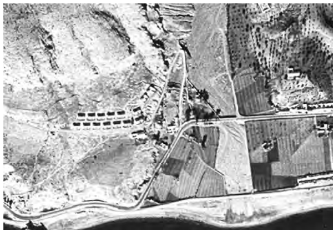
Figura 6. Fotografía aérea de 1956, donde se aprecia cómo eran las rampas del Primer Cantal, junto a la desembocadura del arroyo Totalán.