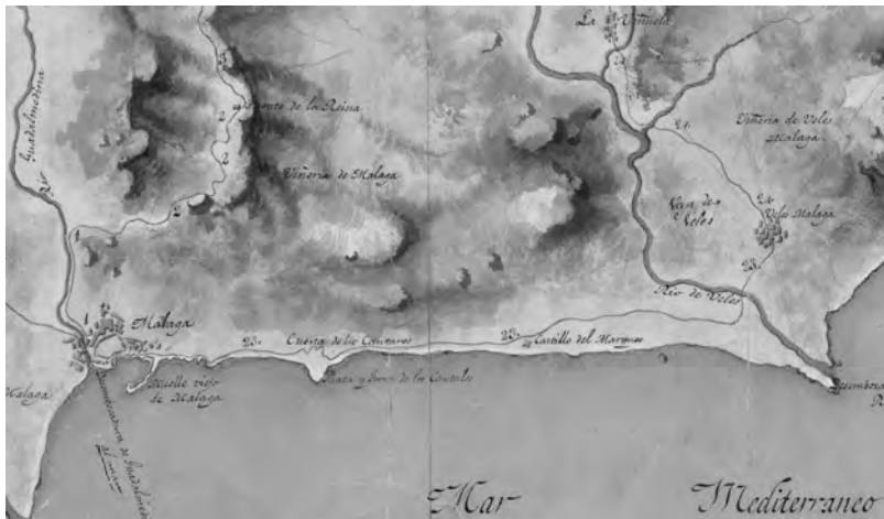
Figura 1. Detalle del mapa (1790) de la parte del mar Mediterráneo que comprende la costa de Málaga (véase plano completo en apéndice). Se muestra el Camino de Vélez, recién terminado.